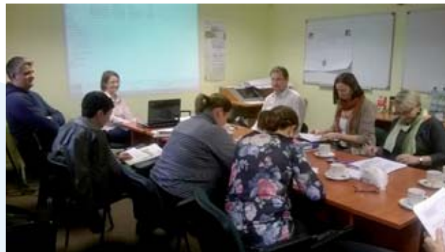
Doradcy zawodowi z zielonogórskiego CiPKZ prowadzili zajęcia warsztatowe dla 51 kuratorów sądownych

Zamieszczano i aktualizowano informacje na stronach www.wup.zgora.pl oraz www.doradcazawodowy.zgora.pl .