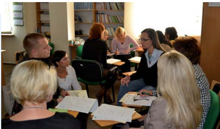
Zajęcia warsztatowe dla doradców zawodowych dotyczące rekrutacji i selekcji pracowników prowadzone w gorzowskim CiPKZ.

Osoby wyjeżdżające do innego kraju Unii Europejskiej i Europejskiego Obszaru Gospodarczego mogą starać się o potwierdzenie okresów zatrudnienia w kraju na drukach U1 i U 002 z takiego uprawnienia skorzystało 74 osób.