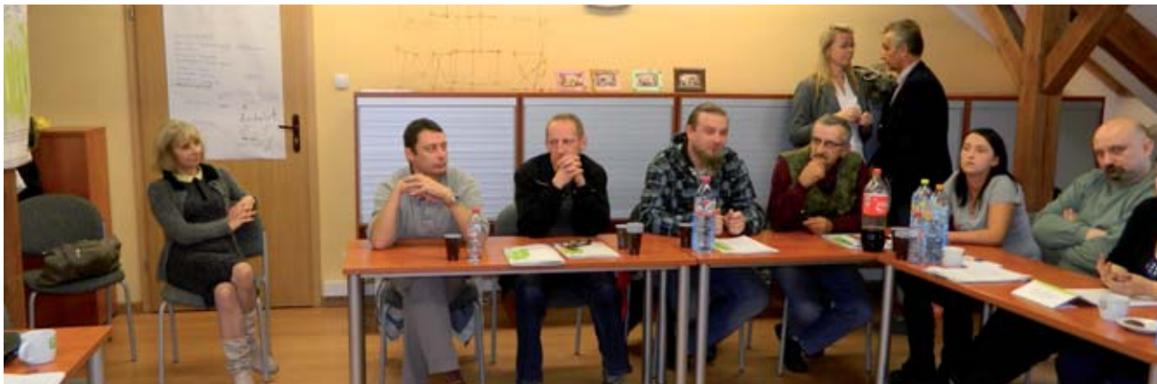
Projekt pt. „PI-PWP TRANSADAPT” realizowany we współpracy z partnerem ponadnarodowym polega na transferze i adaptacji w województwie lubuskim niemieckich metod aktywizacji osób długotrwale bezrobotnych.

lenia, praktyki lub staże zawodowe oraz zwrot kosztów opieki na dzieckiem i osobą zależną.