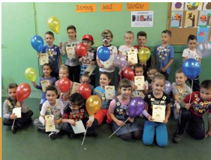
Projekt „Kolorowy Świat Talentów” skierowany był do dzieci i rodziców Szkoły Podstawowej w Skwierzynie.

Pragniemy przypomnieć, że każda pomoc, usługa, wsparcie jest prowadzone BEZPŁATNIE , a jeśli zainteresowaliśmy Państwa naszymi wynikami pracy to zapraszamy do kontaktu z gorzowskim centrum.