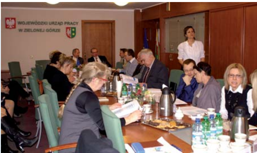
Jedno z pięciu posiedzeń Wojewódzkiej Rady Zatrudnienia w 2013 roku.

W ramach ORP realizowane są stałe informacje, analizy i opracowania, w tym: a) miesięczne: meldunek o liczbie bezrobotnych, Informacja miesięczna (ogólna), Bezrobotni w szczególnej sytuacji na rynku pracy według gmin; b) kwartalne: wkładka do informacji miesięcznej (bezrobotni według czasu pozostawania bez pracy, wieku, wykształcenia i stażu pracy)