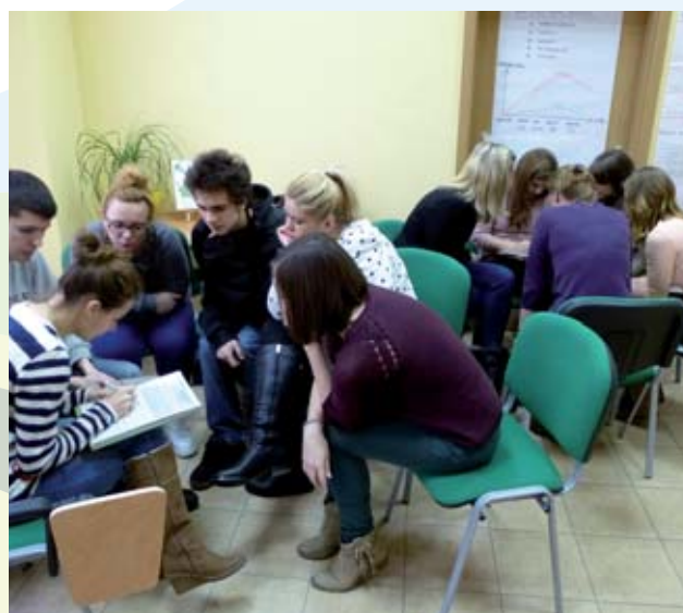
Warsztaty przybliżające wiedzę dotyczącą tworzenia spółdzielni socjalnych dla studentów Uniwersytetu Zielonogórskiego.

Zachęcamy również do odwiedzenia facebook-a, na którym umieszczamy bieżące informacje oraz przedstawiamy ES z perspektywy subregionu zielonogórskiego.