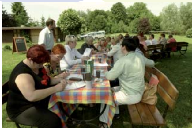
Wizyta studyjna w Spółdzielni Socjalnej w Sierczynku w czerwcu 2013 roku.

W ramach działań promocyjnych w roku 2013 został także przygotowany Katalog Produktów i Usług PES subregionu gorzowskiego, którego celem jest promowanie prowadzonej przez PES działalności. W siedzibie OWES przy ul. Kombatan-tów 34 (IV piętro) w Gorzowie Wlkp. dostępne są materiały informacyjno – promocyjne w postaci ulotek i informatorów związanych z tematyką ekonomii społecznej.