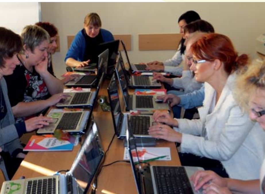
Zajęcia komputerowe prowadzone w gorzowskim CiPKZ.

Ponadto wydano na wniosek osób uprawnionych 24 zaświadczenia stwierdzające charakter, okres i rodzaj działalności na terenie RP.