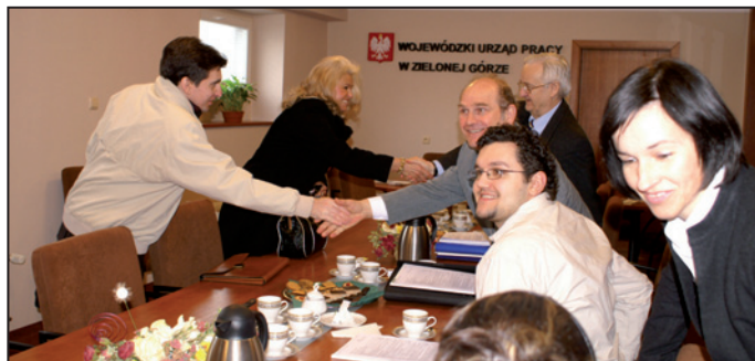
W sali konferencyjnej witają się przedstawiciele Izby Rzemieślniczej i Przedsiębiorczości z Zielonej Góry z przedstawicielami Izby Rzemiosła i Przedsiębiorców z Gorzowa Wlkp.

9 kwietnia br. w Wojewódzkim Urzędzie Pracy w Zielonej Górze odbyło się spotkanie na temat „Dostosowywania kwalifikacji kadr do potrzeb pracodawców przy uwzględnieniu wykorzystania środków EFS w ramach Programu Operacyjnego Kapitał Ludzki”.