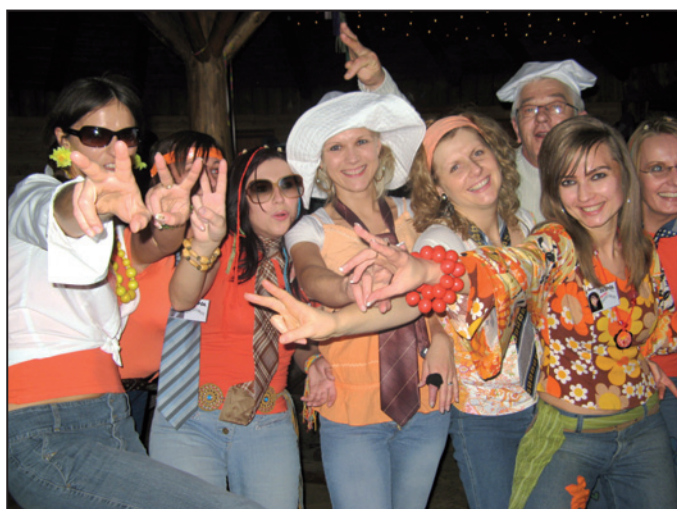
Wieczorem - kolorowe stroje i dobre nastroje ... motywy lat 70. i 80. nie zawiodły.