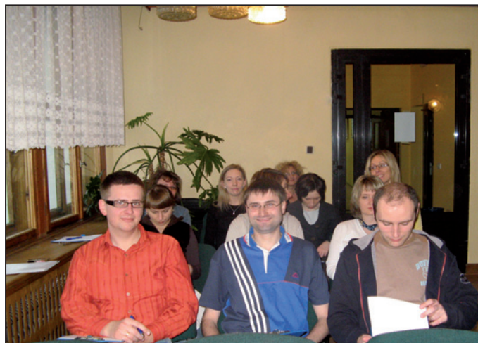
Najwięcej pytań sędziemu zadawały panie z drugiego i trzeciego rzędu. Nic dziwnego, pracują w Wydziale Obsługi Rynku Pracy i one wydają najwięcej postanowień i decyzji.