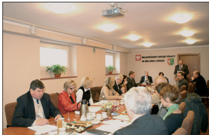
Drugie w tym roku posiedzenie WRZ w Zielonej Górze.