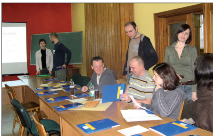
Za chwilę zacznie się szkolenie z procedur kancelaryjnych i archiwalnych.

Weekend (19–20 kwietnia br.) pracownicy Wojewódzkiego Urzędu Pracy spędzili w Sosnowcu koło Karpacza. Centrum Metodyczne Doskonalenia Zawodowego przygotowało dla nich szkolenia. Ale nie zabrakło czasu na wypocinek i rekreację.