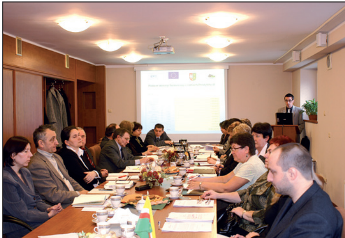
Głównym tematem spotkania był podział środków Funduszu Pracy.

21 lutego br. przedstawiciele Wojewódzkiego Urzędu Pracy spotkali się z dyrektorami powiatowych urzędów pracy. Tematem przewodnim był podział środków Funduszu Pracy na finansowanie programów na rzecz promocji zatrudnienia, łagodzenia skutków bezrobocia i aktywizacji zawodowej oraz innych fakultatywnych zadań.