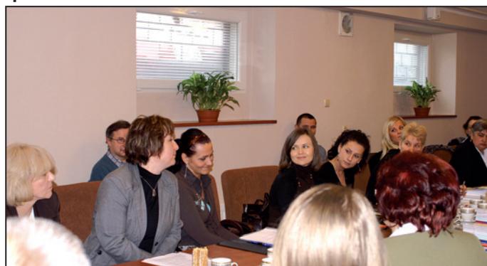
Statystycy z zainteresowaniem słuchali wystąpień przedstawicieli Urzędu Statystycznego w Zielonej Górze.

30 stycznia br. odbyła się w Wojewódzkim Urzędzie Pracy narada z pracownikami powiatowych urzędów pracy zajmujących się statystyką. Omawiano zmiany dotyczące sprawozdawczości w 2008 r.