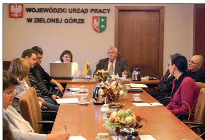
Na spotkaniu omawiano prawa i obowiązki agencji zatrudnienia.