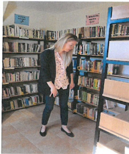
Piękne wnętrze biblioteki