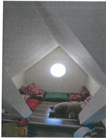
Biblioteka szkolna w Cigacicach, dział dla najmłodszych.