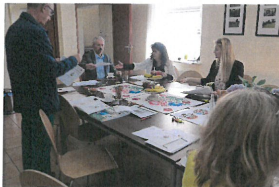
Uczestnicy spotkania. Przeglądamy PORTFOLIO