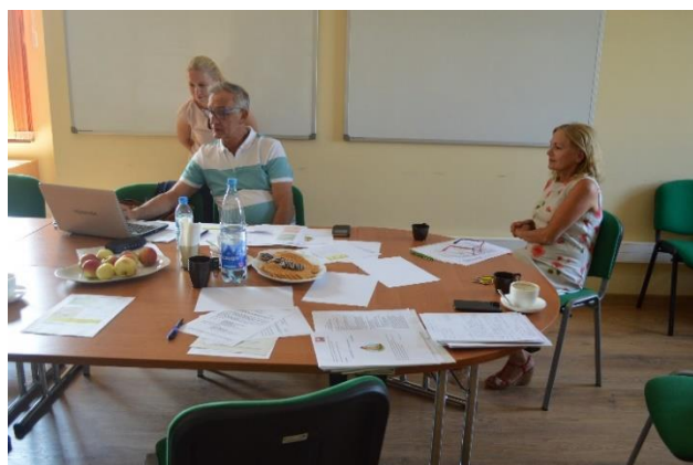
Analizujemy i dyskutujemy