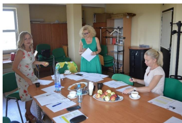
Przełqdamy, myślimy i ustalamy