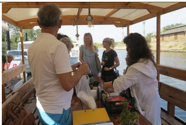
Za chwilę odpływamy